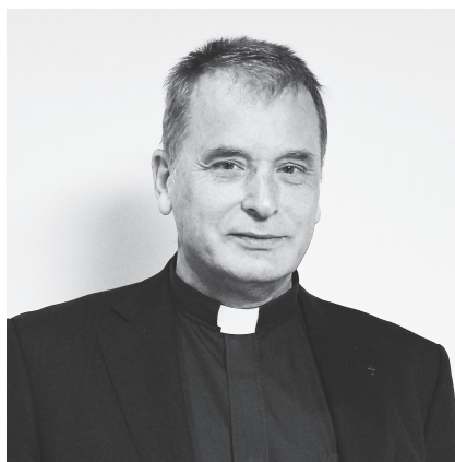
南山大学長 ミカエル・カルマノ